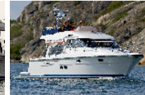
Storebro 435 Commander