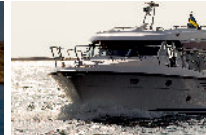
Storebro 435 Suntop