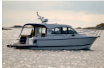
Nimbus 335 Coupé