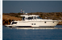
Nimbus 43 Nova