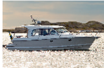
Nimbus 365 Coupé